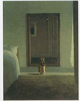
「エスターハージー王子の冒険」より