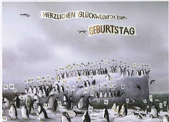
ペンギンバースデー