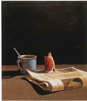
「ちいさなちいさな王様」より