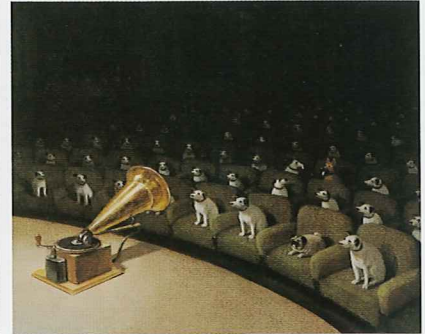
Their master's voice