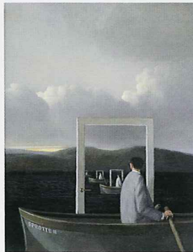
「ちいさなちいさな王様」より