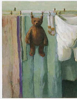
「クマの名前は日曜日」より