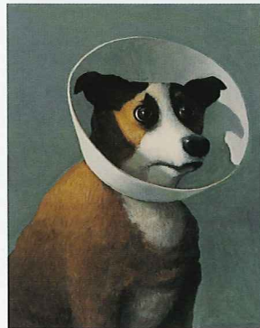
治療中の犬/アメリ